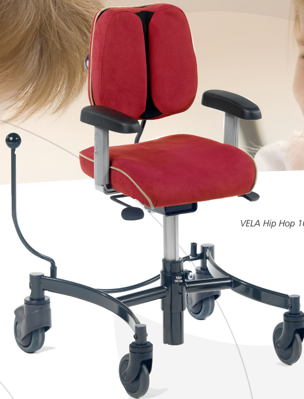
VELA Hip Hop 100

Der VELA Hip Hop 100 ist ein intelligenter Stuhl für das Arbeiten am Tisch in der Schule und zu Hause. Er passt bequem unter einen Tisch und das zurückhaltende, platzsparende Design ist ideal z.B. für die Küche oder das Klassenzimmer.