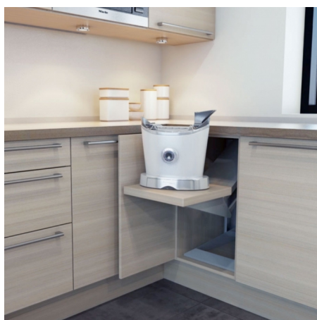
Die Plattenhöhe lässt sich stufenlos einstellen.