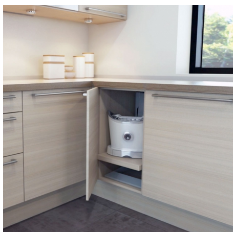
Der Unilift im eingefahrenen Zustand.

Der UNILIFT eignet sich für viele Zwecke. Zum Beispiel hebt er Ihnen im Haushalt schwere Küchengeräte, Haushaltsmaschinen - oder in Laboren Zentrifugen und vieles mehr, bequem und stufenlos auf die gewünschte Höhe.