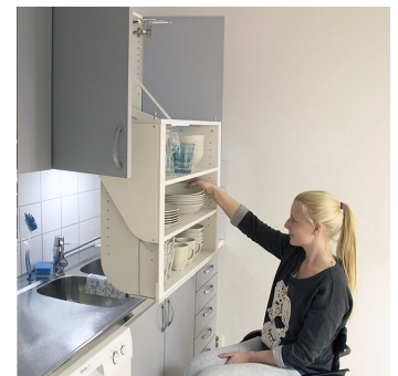
Durch die Vorwärtsbewegung beim Absenken, wird der Schrankraum optimal zugänglich und kann leicht ein- oder ausgeräumt werden.