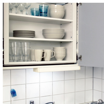
Am Schrankunterboden müssen keine Veränderungen vorgenommen werden. Bei Nachrüstungen kann eine evtl. vorhandene Beleuchtung montiert bleiben.