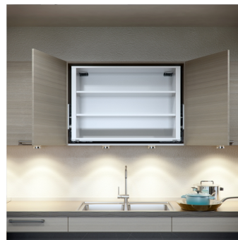
Die Mechanik und die Motoren sind sehr platzsparend im Schrank integriert.