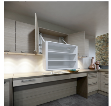
Der InDiago kann in neue oder vorhandene Oberschränke integriert werden.

Der InDiago ist ein motorisch stufenlos verfahrbarer Oberschränkeinsatz. Der Lift kann ohne große Änderungen in neue oder vorhandene Oberschränke integriert werden. Es sind keine Änderungen am Schrankunterboden oder der evtl. vorhandenen Beleuchtung notwendig. Das System beinhaltet auf Wunsch einen automatischen Türöffner, der Ihnen die Schranktüren beim Herunterfahren öffnet. Beim Hochfahren werden die Türen sanft geschlossen. Der Lift ist in zwei Tiefen und mehreren Breiten von 50,0-100,0 cm erhältlich. Der InDiago ist mit einem zuverlässigen Sicherheitssystem zu Minimierung des Klemmrisikos ausgerüstet.