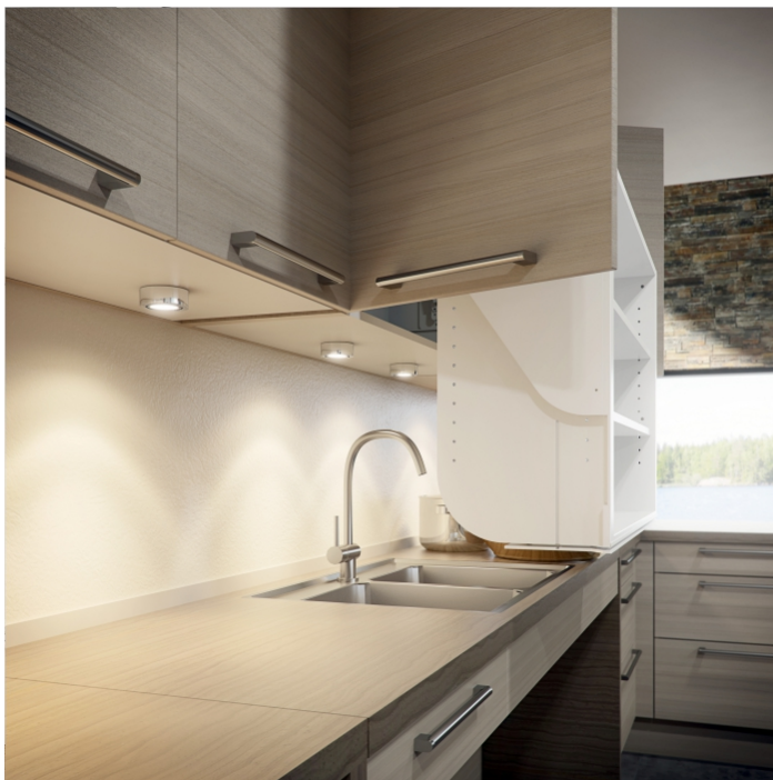
Durch die diagonale Abwärtsbewegung bleibt hinten genug Raum für die Armatur.

Der InDiago ist ein motorisch stufenlos verfahrbarer Oberschränkeinsatz. Der Lift kann ohne große Änderungen in neue oder vorhandene Oberschränke integriert werden. Es sind keine Änderungen am Schrankunterboden oder der evtl. vorhandenen Beleuchtung notwendig. Das System beinhaltet auf Wunsch einen automatischen Türöffner, der Ihnen die Schranktüren beim Herunterfahren öffnet. Beim Hochfahren werden die Türen sanft geschlossen. Der Lift ist in zwei Tiefen und mehreren Breiten von 50,0-100,0 cm erhältlich. Der InDiago ist mit einem zuverlässigen Sicherheitssystem zu Minimierung des Klemmrisikos ausgerüstet.