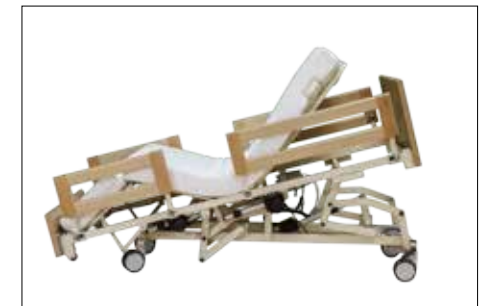
Sitz- und Pflegeposition