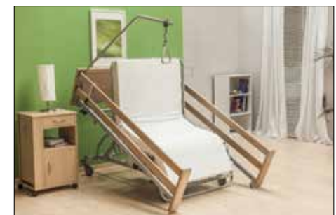
forza aktiv mit durchgehenden Seitengittern