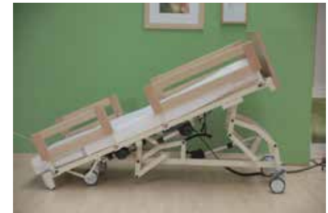
Trendelenburg / Anti-Trendelenburg