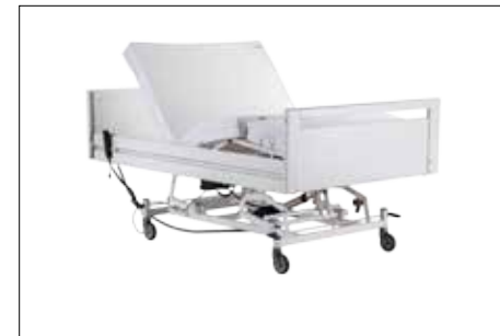
Kopf- und Fußteilverstellung