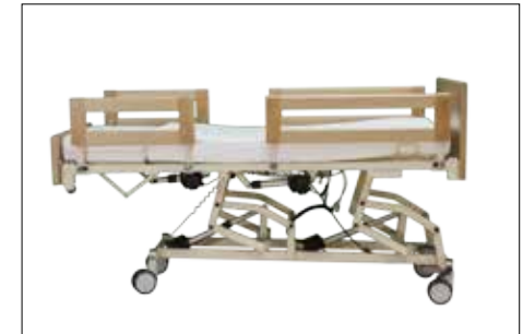
Hochstellung der Liegefläche