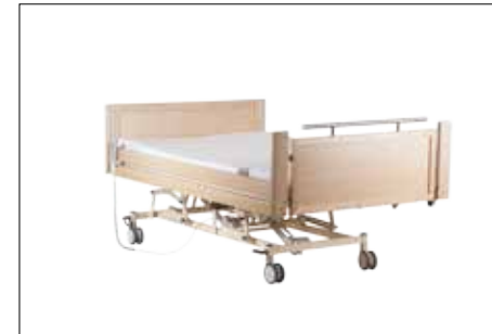
Tiefstellung der Liegefläche