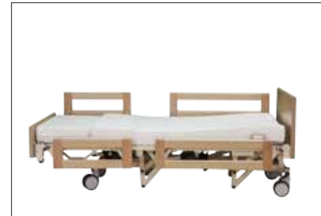
Tiefstellung der Liegefläche / Liegeposition