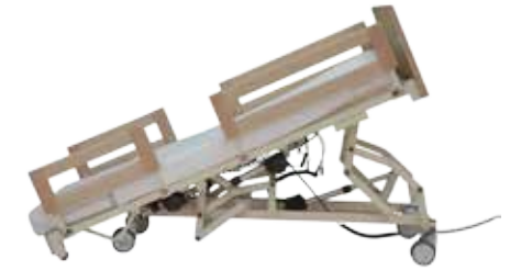
Trendelenburg / Anti-Trendelenburg