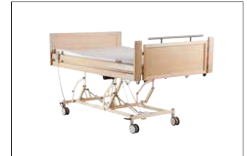
Hochstellung der Liegefläche