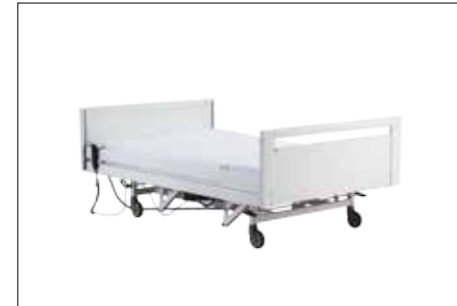
Niedrigstellung der Liegefläche