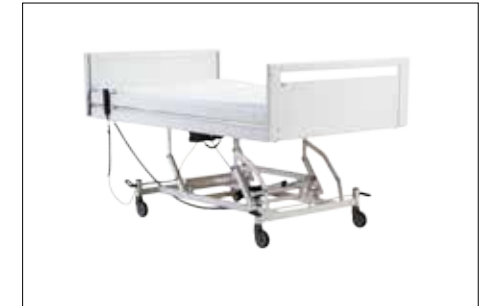
Hochstellung der Liegefläche