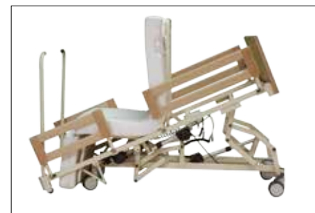
Sitz- und Ausstiegsposition